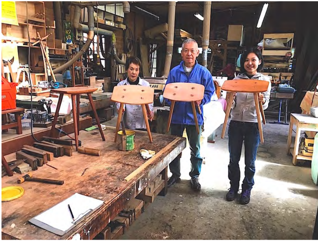
2022 富士根北公民館 木工教室